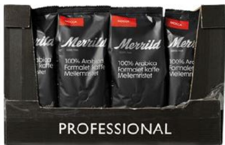
Kolli GTIN 09537542536575